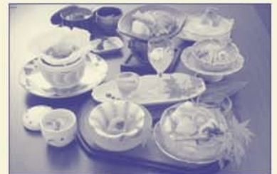
賀茂川会席プラン(基本)

◆山陽路会席プラン、小京都会席プラン、賀茂川会席プランなど夏・秋の食材を使った本格会席料理でおもてなし。(2ヶ月毎に内容が変わります)