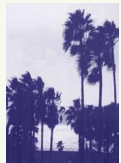
大久野島

保養所News 閉館のお知らせ No.17 ゆの温泉 ホテル「紅葉館」 皆さまに永い間ご利用頂きました「紅葉館」は2009.03.31をもって閉館となりました。ご愛顧有難うございました。