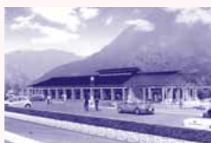
交流体験棟(イメージ)