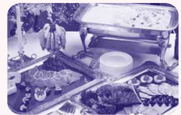
※バイキング料理のイメージ写真

◆地元の食材や四季の素材をふんだんに盛り込んだお料理をバイキング形式でご堪能ください。