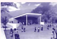
野外ステージ(イメージ)

レストラン、売店、多目的ホール、広間他。併設して交流体験館(交流サロン、観光案内所、調理体験室、会議室)、特産品市場館、屋外ステージ、農業体験場、足湯があります。