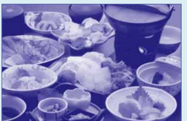
写真は郷の四季コース

■お料理 地場近隣の食材をふんだんに取り入れた会席料理など各種プラン、コースがあります。