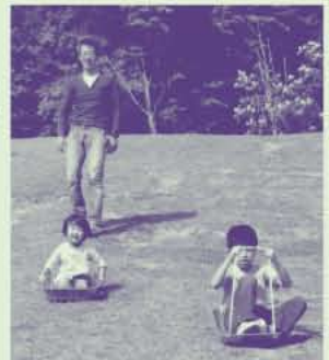
芝すべり:筆者とお子さん達

毎年、友人家族と一緒に旅行をする為に各地の契約保養所を利用していましたが今回は帝釈峡を利用していただきました。高速から近く、東城ICから約15分で到着しました。