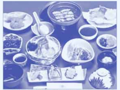
写真は基本夕食コース(平日限定)です。

リーズナブルな料金で四季薫るおいしさのおもてなし。 休日は平日のお料理よりグレードアップ。各種コースがあります。