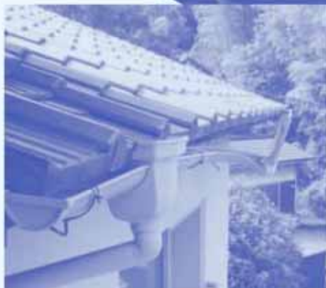
◀強風により樋がねじまがったH氏宅