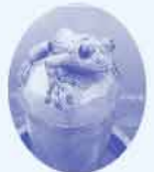
恋谷橋にある縁むすびかじか蛙

当館の庭、キュリー広場から湧き出る源泉からそれぞれの浴槽に100%の純温泉を配湯。