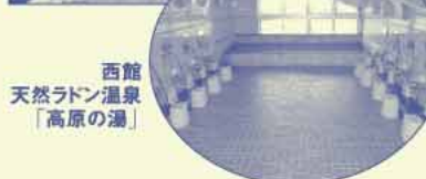
西館 天然ラドン温泉 「高原の湯」