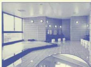
東館 天然ラドン温泉 「高原の湯」

東館:展望大浴場、サウナ付き(天然温泉)男女各1。 西館:大浴場(天然温泉)男女各1 【泉質】含弱放射能一ナトリウム一塩化物・炭酸水素塩