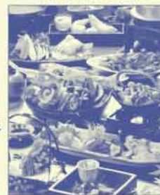
東館 のどぐろと 虎魚(おこぜ)の会席

◆地元の新鮮な高原野菜と日本海・瀬戸内海より直送の新鮮な旬の魚を、彩り華やかにお楽しみ頂ける約50種類の「旬彩バイキング」のほか、料理長おすすめのおこぜやのどぐろを使った特別会席料理など。朝食はバイキング。