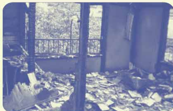
全焼被害のBさん宅