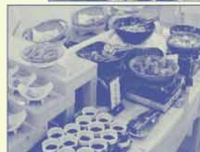
西館 高原バイキング

◆地元の新鮮な高原野菜と日本海・瀬戸内海より直送の新鮮な旬の魚を、彩り華やかにお楽しみ頂ける約50種類の「旬彩バイキング」のほか、料理長おすすめのおこぜやのどぐろを使った特別会席料理など。朝食はバイキング。