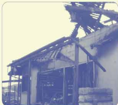
全焼被害のAさん宅