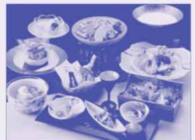
写真は 冬 太閤プラン

料理長匠プランをはじめ、宝舞プラン、太閤プランなど各種会席コースの夕食。 朝食は和洋食バイキング。