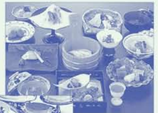
会席プラン (イメージ)

宿泊代、朝食代、会席料理代がセットになった会席プラン、宿泊代、朝食代、ビュッフェスタイルの夕食がセットになったビュッフェパーティプランなど大変お得なプランもご用意できます。お食事場所はレストランになります。