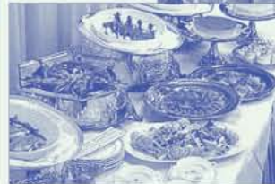
ビュッフェ パーティプラン (イメージ)