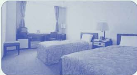
洋室ツインルーム

洋室(ツイン)20室、和室(2人用)2室、和室(4人用)6室 安心してご利用いただける充実した機能の宿泊施設