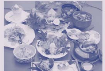
(写真は関サバ海鮮)

鮮度にこだわり、市場で魚の状態を確かめたくて仲買から購入します。 関アジ、関サバ、国東のアナゴ、白杵のフグなど、その季節いちばんの味をお届けします。 大分究極のグルメブランドである絶品の「関さば」をぜひお召し上がりください。