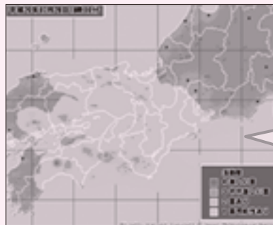
(気象庁ホームページより掲載)

雷ナウキャストは雷の活動の激しさや雷の可能性を1km格子単位で解析し、その1時間後(10分~60分先)までの予測を行うもので10分毎に更新されています。最新の落雷の状況を雨雲の分布によって活動度1~4で表します。