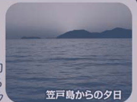
笠戸島からの夕日

笠戸島ハイツは、夏は海水浴場や釣り、マリンレジャーが楽しめ、秋から冬にかけては周防灘に沈む真っ赤な夕日が絶景です。建物は黒川紀章氏の設計で海と島をイメージした特長のある建物で、名物の「笠戸ひらめ」料理や四季折々のお料理が楽しめる宿です。眼下には海上遊歩道があるので、海を満喫しながらゆっくり散歩するのもよし。但し、日頃運動不足の人には結構キツイとの噂あり。