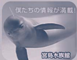
僕たちの情報が満載!

宮島水族館と連携し、「みやじま杜の宿の宿泊+宮島水族館ナイトツアー」をセットにした特別プランを企画。このプランで宿泊すれば、照明の消えた「夜の水族館」で、生きものたちの夜の生態を飼育員の方の解説を聞きながら見学するツアーに参加でき、普段、見ることのできない「夜の水族館」を観覧できます。