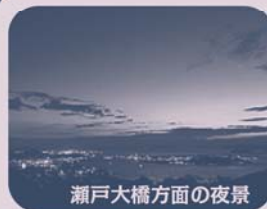
瀬戸大橋方面の夜景

瀬戸大橋を渡り香川県に入ると休暇村「讃岐五色台」はもう目の前、と思うと意外にここから時間がかかるように思います。五色台へ上るルートは4本あるそうで、どのルートで上がるかで時間が違ってきます。そうして上った山頂近くに休暇村「讃岐五色台」があります。心に残る絶景!瀬戸大橋と瀬戸内海を望む美しい夕陽のスポット五色台と謳うだけあって、ここからの眺めは最高です。