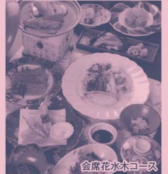
会席花水木コース

『幸せのものさしは人それぞれだけど、美味しいお食事をする時って、きっと全ての人が幸せになる瞬間。だからひとしな一品全力で最善を尽くしてお創りします。』と料理長。朝食は和洋バイキング(和定食の事もあります)です。