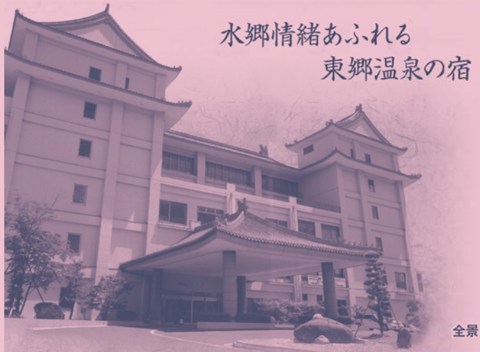
水郷情緒あふれる 東郷温泉の宿

山陰八景の一つとされる東郷湖の南岸に位置する東郷温泉は、明治時代に開かれました。もともとは自然に湖底から噴出していた湯で、湖に住む鯉が教えたという伝説が残っています。今も湖面に湯気が湧き上がり、温泉郷ならではの景観を見せています。まるで湖上に浮かんでいるかのような景観にあるのが、国民宿舎 日本第1号の宿「水明荘」です。