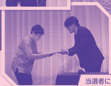
当選者にサイン色紙を プレゼント