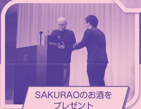
SAKURAOのお酒を プレゼント